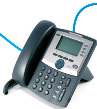
telefon IP ze switchem